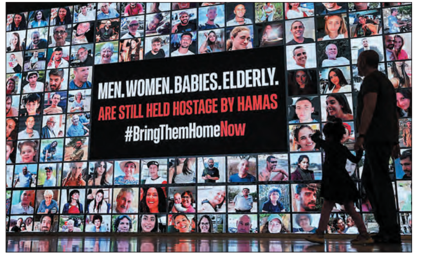
A Gázában fogva tartott túszok szabadon engedését követelő poszter Tel-Avivban

Aki egyszer is ránézett már a térképre. Arra a furcsa formájú alakzatra, a keskeny területre, a