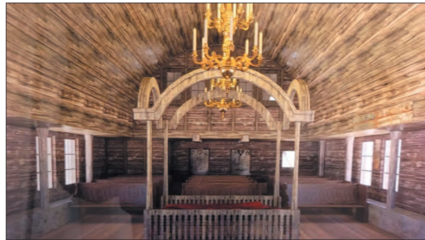
A fazsinagóga rekonstruált képe

A Magyar Zsidó Múzeum és Levéltár új tárlatán látható deszkaelemek nemcsak azért becsesek, mert Magyarország és Erdély területén a názánfalvin kívül egyetlen más fazsinagóga sem épült soha, hanem azért is, mert annak dacára, hogy a lengyel-litván területeken a 16. századtól széles körben elterjedtek voltak a fazsinagógák, a náciizmus