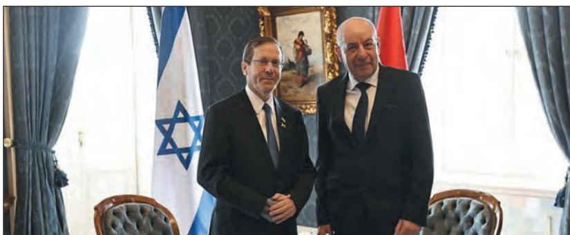
Jichák Hercog és Sulyok Tamás

Az izraeli elnök nem sokkal Gideon Szaár külügyminiszter látogatása után érkezett hazánkba. Orbán Viktor tavaly novemberben Benjámín Netanjahu izraeli miniszterelnököt is meghívta Magyarországra.