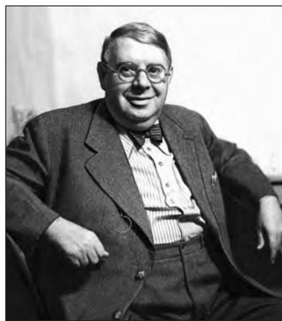
Szőke Szakáll (1883–1955)

Grünwald Jakab 1883-ban született Budapesten, s mint oly sokan a pesti kabaré világában, ő is Nagy Endre szárnyai alatt kezdte a szakmát. Számos pesti kabaré állandó szereplője, szerzője vagy éppen vezetője volt (Modern Színpad