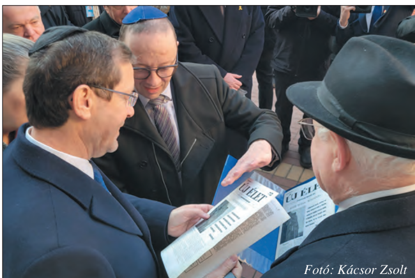
A vendéglátók ajándékokat nyújtanak át az izraeli államelnöknek, mégpedig az Új Élet egyik 1991-es számát, amely részletesen beszámol Jichák Hercog édesapjának, Izrael akkori államelnökének látogatásáról