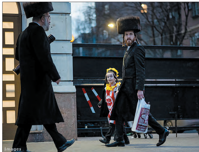
A férfiak strájmilit, óriási szőrmekalapot viselnek

De mit is jelent az, hogy haszid? Maga a szó a héber heszed -ből ered, jelentése: jámborság, kegyelem, hű szeretet. A 18. század közepén indult ultra-ortodox irányzat hívei elutasították az asszimilációt, nem kívántak betagozódni a többségi társadalomba, és a vallás bensősége megélését tartják a legfon-